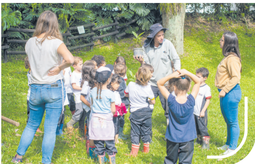
El contacto con empleados del Colegio facilita el conocimiento de otros contextos.

Somos conscientes de que, para que haya aprendizaje, debemos fomentar metodologías que lo promuevan. Nuestros profesores acompañan esos procesos y proponen que sean los mismos estudiantes los que transformen la información en conocimiento, a través de exposiciones, descubrimientos espontáneos, vivencias, experimentos o resolución de problemas.