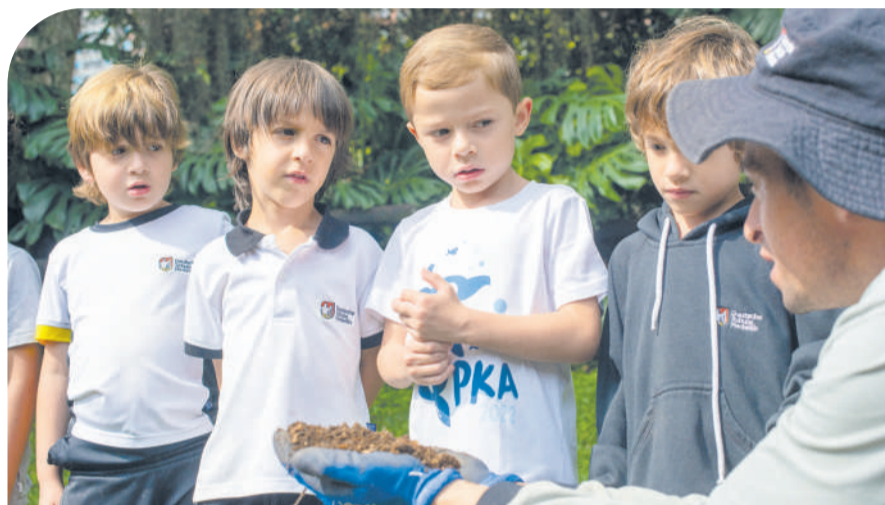
Desde Kindergarten comienza la interacción con la naturaleza.

Nuestro objetivo es formar ciudadanos del mundo y, para ello, deben conocer el entorno en el que están. Nos interesa también que conozcan la ciudad y el mundo que los rodea. Tanto una salida pedagógica a parques y museos de la ciudad, como el recorrido que se hace en el transporte escolar desde diferentes lugares